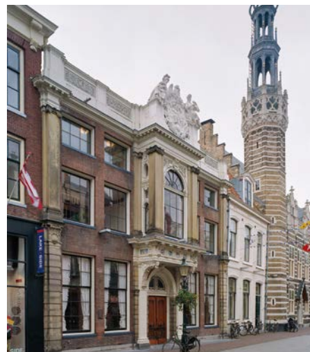
Dubbele erker uit 1648 bij Janskerkhof 13 in Utrecht. C.S. Booms 2018